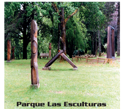
Parque Las Esculturas

Parque de las Esculturas . 25 esculturas contemporáneas de gran formato en piedra, metal y madera, de artistas chilenos y extranjeros, ubicadas al aire libre y rodeadas por un bello entorno natural, junto a la Laguna de los Lotos. (Parque Saval, Isla Teja / sólo se paga entrada al Parque Saval).