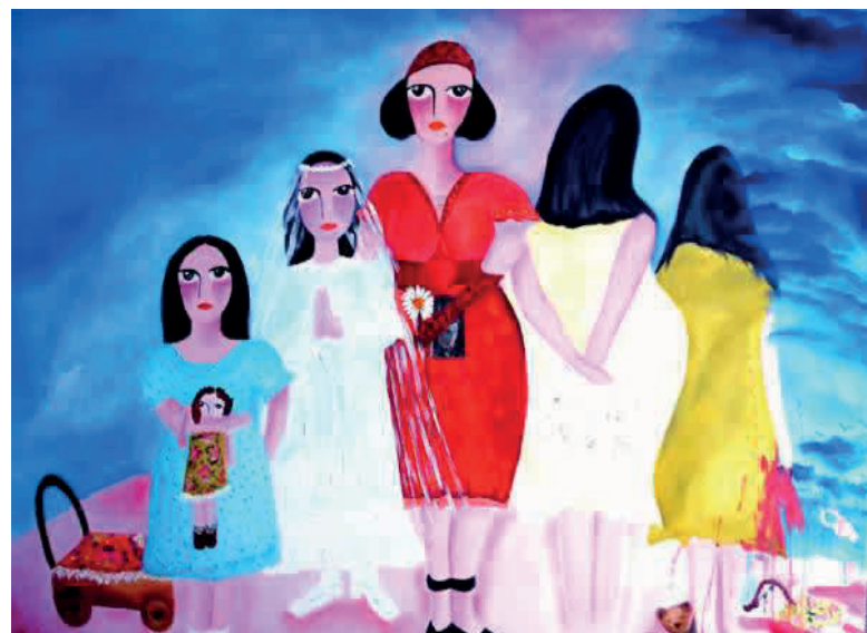
Berta Ayancán, "Y... todo iba bien", óleo sobre tela, 80x120