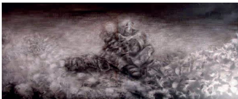
Menashe Katz, sin título, óleo sobre tela, 68x135

Las obras de una parte del grupo se presentaron en febrero de este año